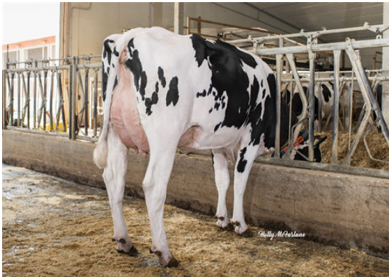
PROGENESIS IMAX PERFECTION DAM