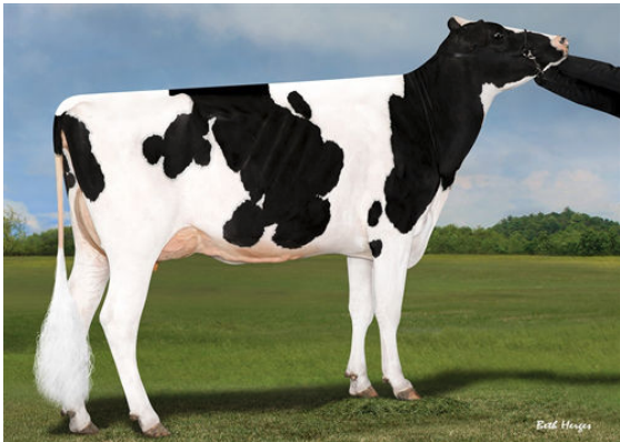
SYNERGY RUBICON PERFECT GRANDDAM